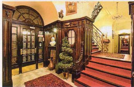
Orient: Die Einrichtung des Hauses ist weitgehend im Original erhalten

Das Hotel Orient in Wien ist aus mehreren Gründen in der österreichischen Hotellerie eine Ausnahmeerscheinung. Es ist wohl das einzige „Stundenhotel“, das erstens in einer offiziellen Hotelliste aufscheint, ja sogar über das Buchungssystem eines Tourismusverbandes gebucht werden kann. Und: Das „Orient“ ist wohl das einzige Haus in dieser