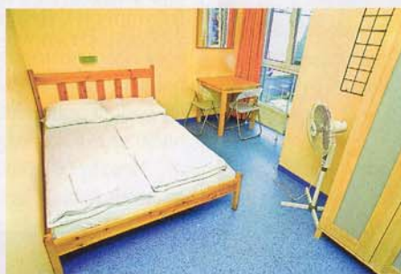
Nächtingung ab 17 Euro

oder anderen billigen Unterkünften für Rucksackreisende. Angeboten werden Zwei-, Vier- oder Sechsbettzimmer, alle mit eigener Dusche und WC und gratis Bettwäsche. Eine