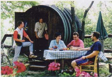
Die Nächtigung im Weinfass kostet pro Person ab 25 Euro ...

Wem der köstliche Wein des Weinviertels zu wenig an Stimmung verschafft, der kann seine Nacht in den wohl einzigen Weinfass Österreichs verbringen, in dem man auch (erlaubterweise) schlafen kann. Ermöglicht wird dies im malerischen Weinbauort Platt bei der Familie Kraus. „Erholung in familienfreundlicher Atmosphäre, ruhige Lage, gute Weine