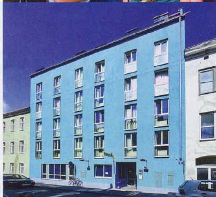
Erstes wombat's hostel „The Base“ in Wien, eröffnet 1999