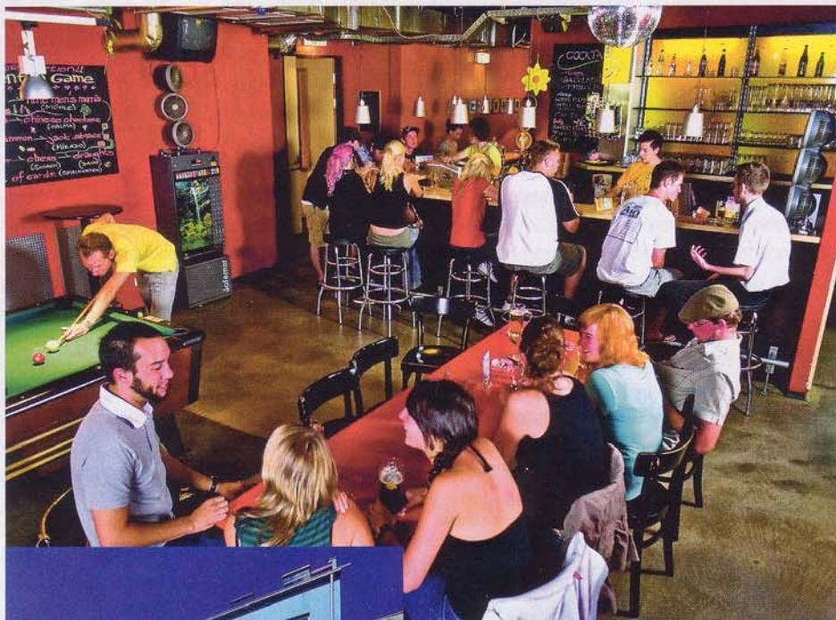
Die wombat's hostels: Bereits stolze 346.000 Nächtingungen

Das Hotel, eigentlich Hostel, unterscheidet sich deutlich etwa von Jugendherbergen